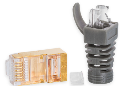
RJ45 Cat 8

Stiftmaterial: 24K vergoldetes Kupfer Stiftanschluss: Crimp Kontaktkropp: 24K vergoldeter metallisierter Kunststoff Bildschirmanschluss: Ja, Gehäuse Zugentlastung: Ja, Druckverriegelung Knickschutz: Ja Crimpwerkzeug: Standard, z. B. Knipex 975110