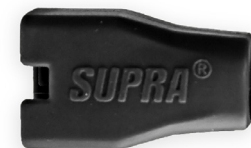
RJ45 Cat 7+

Verkauft im 50er-Pack nur an Wiederverkäufer, aber pro Stück im Geschäft